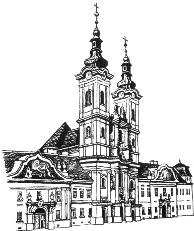
Hasonló részletezettségű képeken lesz látható Kanizsa sok fontos épülete a tervezett „Kanizsa madártávlati képe” c. rajzon

programjainkról az interneten keresztül: vegyen részt INGYENES, 5 órás internethasználati minikurzusunkon! Így megtudhatja, hogyan telefonálhat a könyvtárunkba ingyenesen, hogyan informálódhat gyorsan, hogyan használhatja könyvtárunkat otthonról is. Öt tartalmas óra nálunk, s kiderül, mit érdemes megtanulni bővebben is. Október 15-től várjuk jelentkezését a minikurzusra a könyvtárban.