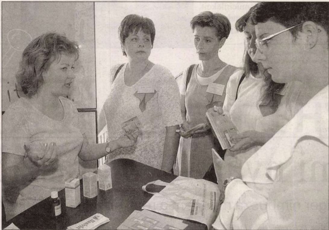
A védőnők a korszerű babaápolási kellékekkel is megismerkedhettek

A gazdasági fellendülés csak egészséges emberekkel valósítható meg