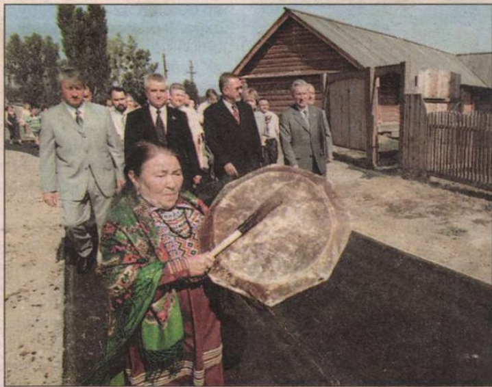
A vendégeket a sámán vezette be a parkba

Az évszázad logisztikai eseménye lesz. (6. oldal)