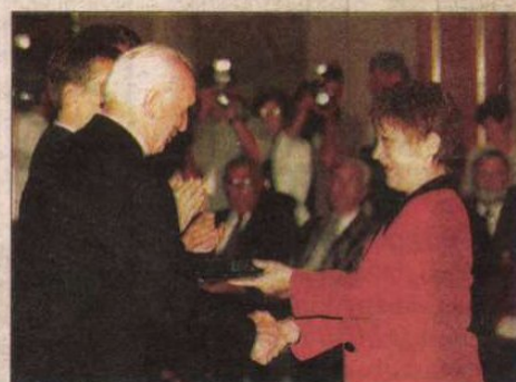
Mádl Ferenc átadja a Magyar Köztársasági Érdemrend Lovagkeresztjét (polgári tagozat) Csűrös Karolának, a Víg-színház művészenek

E szavakat Mádl Ferenc köztársasági elnök mondta, Szent Istvánnak az állammal kapcsolatos gondolatát citálva az augusztus 20-ai állami kitüntetések átadásakor hétfőn, a Parlamentben. Az államfő Orbán Viktor miniszterelnök és Áder János házelnök jelenléte-