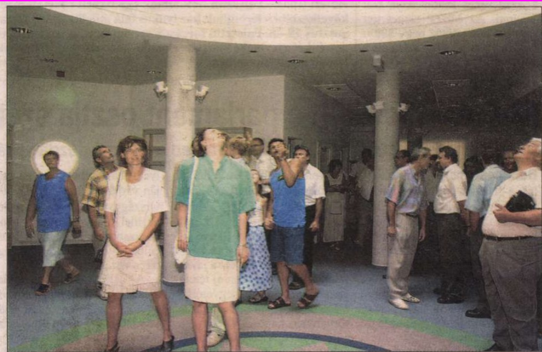
Az avatási ünnepség résztvevői megtekintették az új épületet

ben adta át a kitüntéseket. (Folytatása a 2. oldalon, A szakmai, emberi közeg ítélel címmel.)