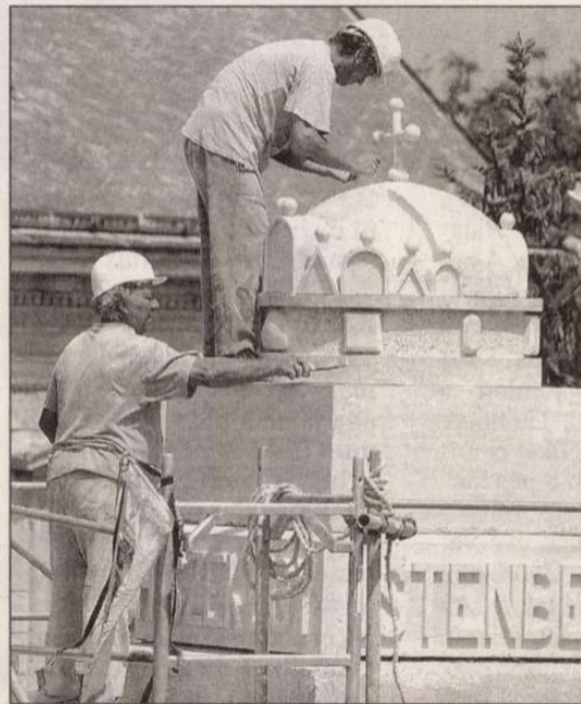
Felkerült a korona az emlékmű tetejére

Már csak a helyszíni restaurálás apróbb fázisai vannak hátra