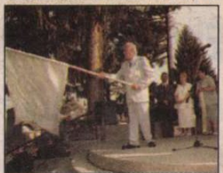
Millenniumi zászlót kapott Bak (8. oldal)