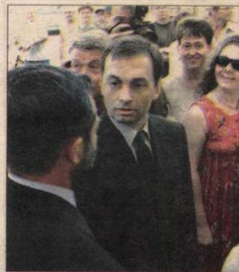
Orbán Vikort köszöntik a hajdúszoboszlóiak.

Ehhez kell igazítania az egészségügyi miniszternek a népegészségügyi programot, amelyet ősszel tárgyal meg a