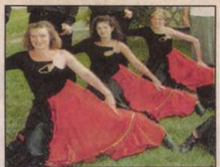
Táncos lábú fiatalok Gősfán (8. oldal)