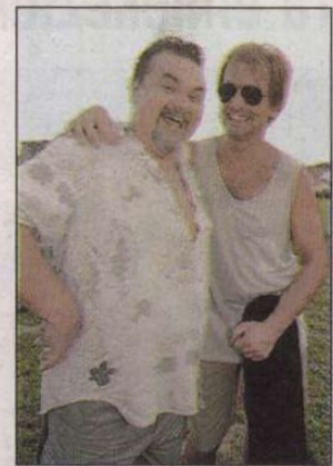
Arcukról sosem fogy el a mosoly, torkukból a nóta. (12. oldal)