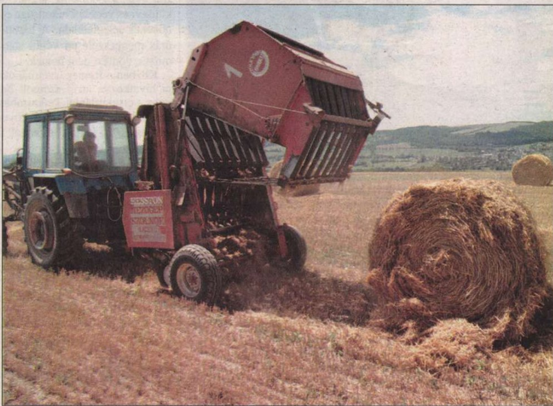
A megyében 28 ezer hektáron begyűjtötték a szalmát is: Simoticséknál 200 bála elég almózisra

Évek óta a legnagyobb területen termeltek búzát a megyében