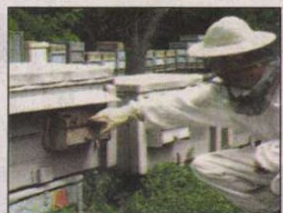
Veszélyes is lehet a méhcsipés (8. oldal)