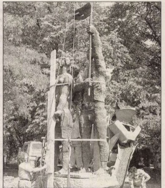
Új helyén a tanácsköztársasági szobor