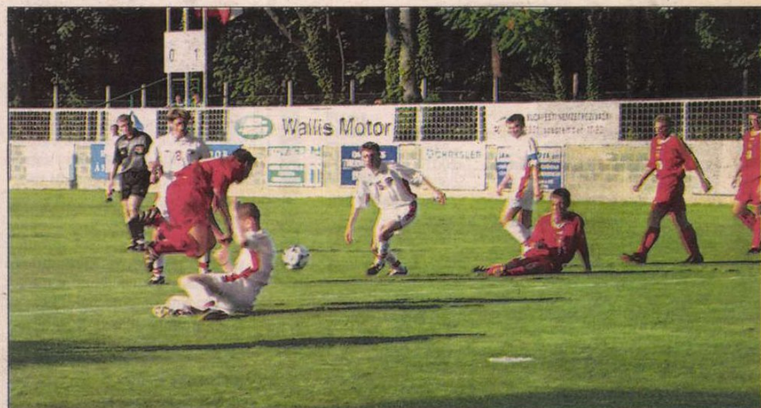
Tegnap Hévízen a lengyelek Svájc együttesével játszottak izgalmas találkozót.

A hajdani Arany Ászok Kupa szervezésében az MLSZ-nek nagyon sokat segít Keszthely önkormányzata, no és Hévíz, valamint Tapolca és Marcali városa is. A keddi nyitótalálkozójukat követően ma folytatódnak a küzdelmek, csütörtökön szünnap, pénteken újabb meccsek lesznek, szombaton pedig a helyosztókat rendezik. (Részletes sportbeszámolóink a 13-14-15. oldalakon találhatóak.)