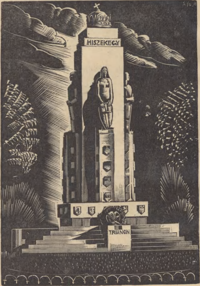
Városunk jelképes irredenta szobra.