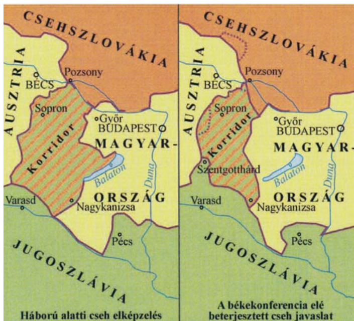
Az úgynevezett szláv korridor

téteket, s történészek szerint az események kiváltotta „megrettenés” sem tett jót az újdonsült határokat kijelölők „lelki nyugalmának”, mondván, ilyen destabil magyar politikai helyzet (többek között az egymást váltó kormányzatok, illetve a kommunista térnyerés) nem sok jót ígérhet az elkövetkezendőkre.