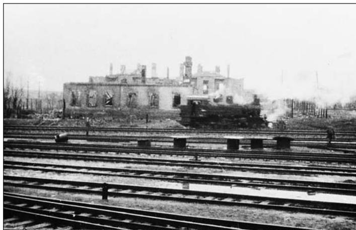
További, Bátki József által készített fotók a www.kanizsaujsag.hu galériájában

Május 30-án elhunyt vitéz Bátki József doni harcos, 56-os forradalmár, vasdiplomás mezőgazdasági mérnök-tanár. Temetési miséje június 14-én, hétfőn 10.30-kor a Sugár úti kápolnában lesz. Azzal délután háromkor a városi köztemetőben búcsúzunk Jóska bácsitól. Novemberben betöltött 90. évével a legidősebb kanizsai piarista öregdiák távozott.