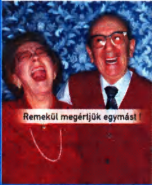
Remekül megértjük egymást

Digitális hallókészülékek a Bazar Udvarban!