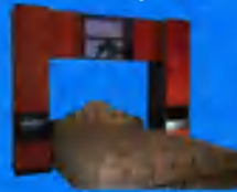
Orsi áthidalós sor 45.800 Ft Franciaágy 42.900 Ft