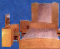
Gold hálószoba- garnitúra 115.100 Ft