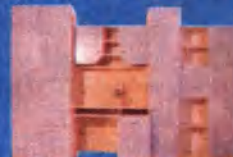
Ifi-Club sor 62.400 Ft