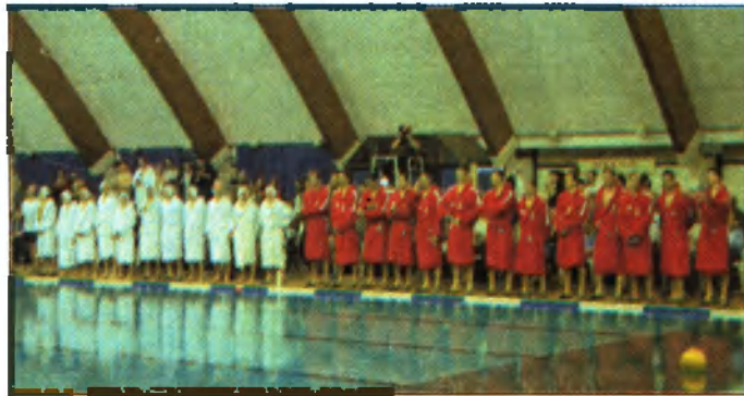
A magyar vízilabda válogatott Nagykanizsán barátságos mérkőzést játszott. A mérkőzésről következő lapszámunkban olvashatnak.