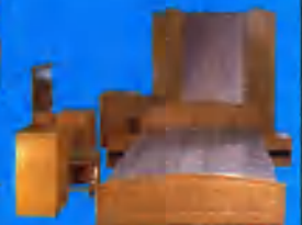
Gold hálószoba-garnitúra 115.100 Ft