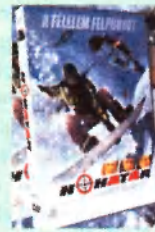
A félelem felpörget

Egy reklámszakemberről, egy rendezőből, és egy operatőrből álló csapat új feladata: egy új videokamera reklámja, három kiváló sielővel, amint túlszárnyalnak egy lavinát. A forgatás helyszínén azonban egy szerb háborús bűnös bujkál egzotikus barátjával, és egy csapat mindenre elszánt terroristával. A sielő csapat: egy gyönyörű síversenyző meg egy 19 éves fenegyerek a stábbal együtt immár az életéért küzd.