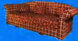
XENA kanapé 42.300 Ft-ól