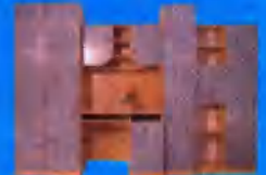
Ifi-Club sor 62.400 Ft