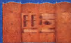
Coloniál 75.100 Ft