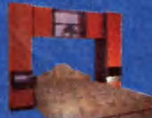
Orsi áthidalós sor 45.800Ft Franciaágy 42.900 Ft