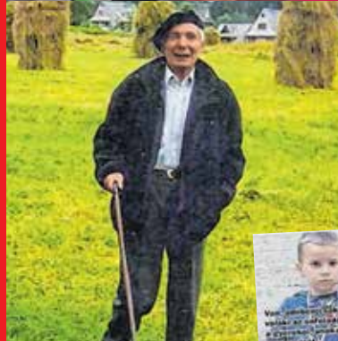
Felczak hitt abban, hogy a szabadság valamikor eljön, el kell jönnie