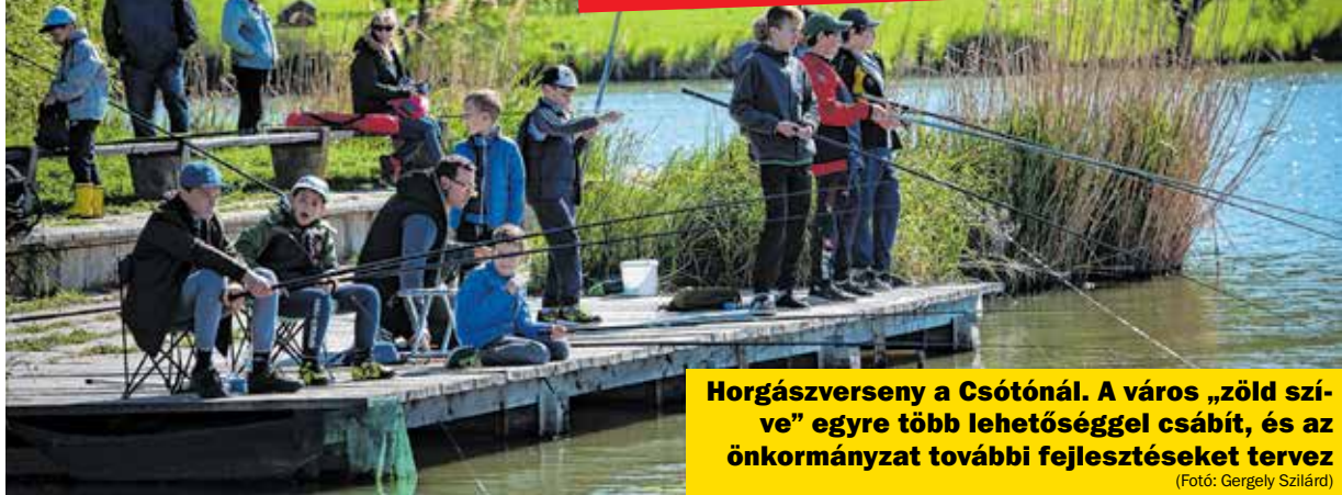
Horgászverseny a Csótónál. A város „zöld szíve” egyre több lehetőséggel csábít, és az önkormányzat további fejlesztéseket tervez