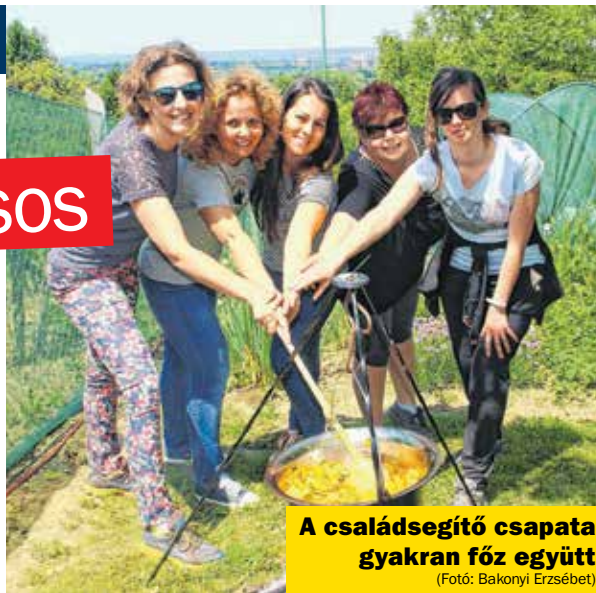
A családsegítő csapata gyakran főz együtt

4 kg apróbb édesburgonya, 1 db padlizsán, 2 db salátacukkini, 15 szál újhagyma, 3 sárgarépa, 4 gerezd fokhagyma, 1 paradicsom, 1 kg csirkemellfilé, olaj, só, bors, bazsalikom, oregano, petrezselyem.