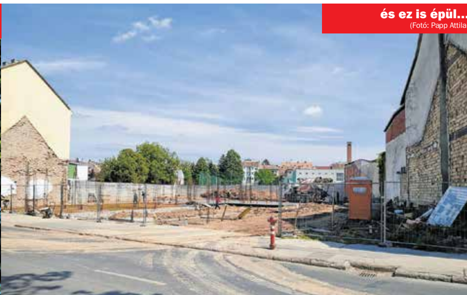
és ez is épül...