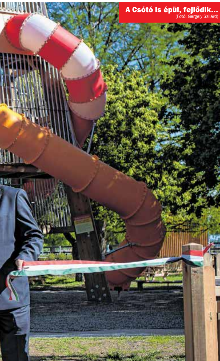
A Csótó is épül, fejlődik...