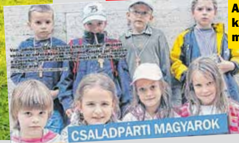
A Kanizsa már decemberben megkérdezte: Belenézhetünk-e gyermekeink, unokáink szemébe?

Mikor e sorokat írom, május 21., a magyar honvédelem napja van. Budavár 1849-es visszafoglalásának évfordulója. Ha ekkor nem, mikor tanulhatnánk meg inkább: az a szó, lehetetlen, nem létezik! Azóta hányszor! - Nincsenek kis nemzetek, csak kishitűek, nincsenek kis emberek, csak kicsinyhitűek. Jobb lenne, ha a napi hírek és az újságok helyett több történelmet olvasnánk – idézte Teleki Pált a minapi Monte cassino-i kiállítás. Mert a történelemből erőt, optimizmust meríthetünk. - A németek a történelem során rengeteg fontos csatát nyertek meg, a háborúkat azonban általában elvesztették – utalt a Terror Háza Múzeum főigazgatója az újabb kísérletre, Európa németek általi leigázására. Schmidt Mária azonban már a Sargentini-jelentés idején figyelmeztetett, mire megy ki a játék: - A nemzetek szuverenitását képviselő erőkkel való látványos leszámolás és a kozmopolita, internacionalista, föderalista erők össznásztánca, aminek ered-