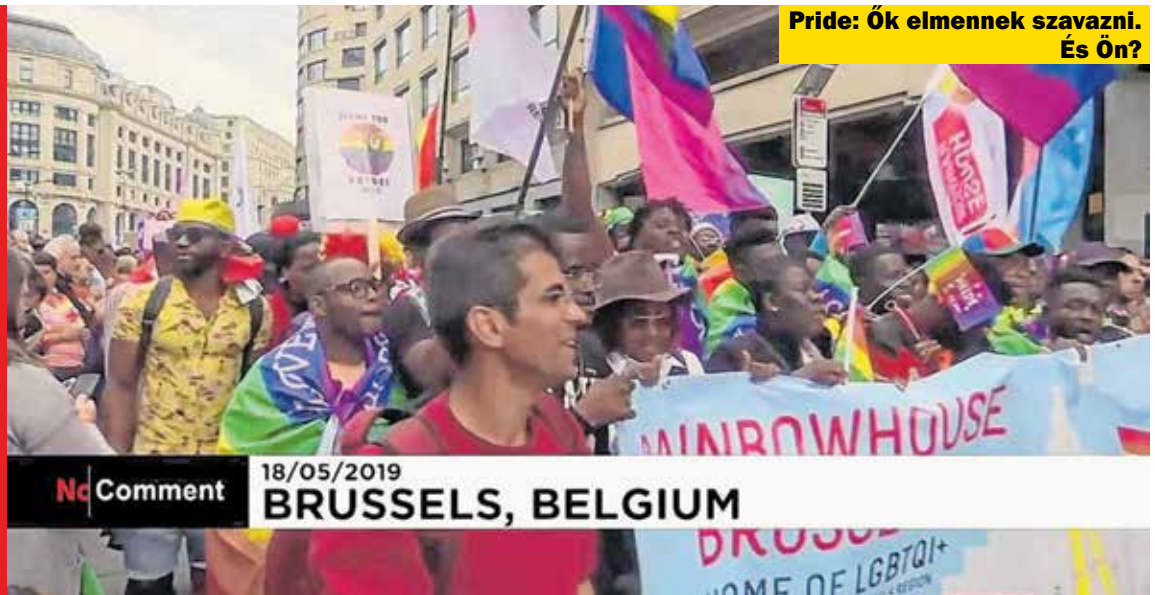
Pride: Ők elmennek szavazni. És Ön?

Egy nyomorgó harmadik világbeli számára Magyarország is Édenkertnek számít. Majd ha hozzánk is beköltözik néhány százezernyi vagy milliónyi közülük... - írta a publicista 2001(!)-ben. A kollaboráns nómenklatúrának az idegenek betelepítésében játszott dicstelen – és az őshonos népesség összetételének drasztikus megváltoztatási kísérlete miatt de jure a nemzetközi egyezményekbe ütköző és bűncselekménynek (etnocidium) minősülő – szerepvállalásáról szolt a Demokratából ismert Gazdag István ugyanakkor. Meghallgattuk?