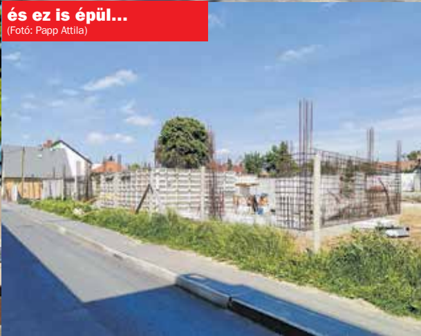
és ez is épül...

kel ellátott, „A” energiasztályú, hőszivattyús hűtő-fűtő rendszerrel készülő társasház első ütemének átadása 2020 tavaszán várható.