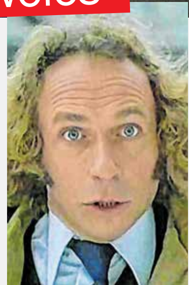
Kérek két gatyót! Ma már kérni se kell?

A „nekem jár” emberek idejét éljük. Nekem jár a vanília fagyi, nekem jár az LCD TV, nekem jár a nyaralás a tengerparton, nekem jár, hogy feltétel nélkül kiszolgálassák nekem a szentségeket, s végül, de nem utolsó sorban: nekem jár, hogy bármi áron gyermekem legyen. És már csak egy lépésre vagyunk attól, hogy majd