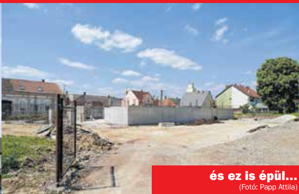
és ez is épül...

Tágas teraszokkal és erkélyekkel „teletűzdelt” társasház készül el itt nemsokára. Külön garázsok és tárolók készülnek minden lakáshoz, sőt, akár saját zöld kertészt is kaphat a