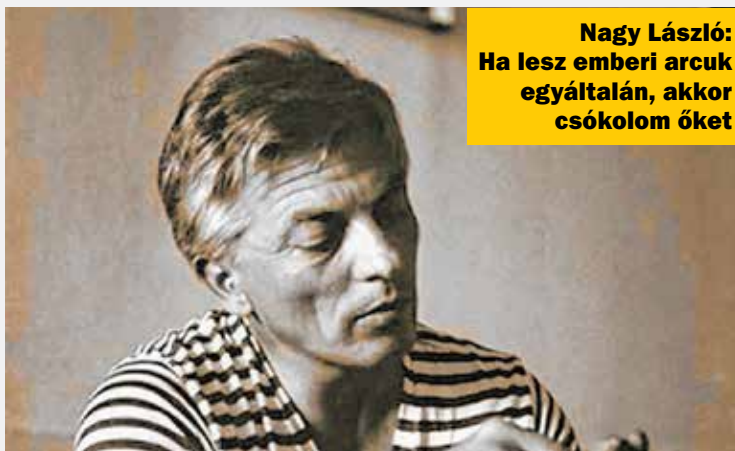
Nagy László: Ha lesz emberi arcuk egyáltalán, akkor csókolom őket