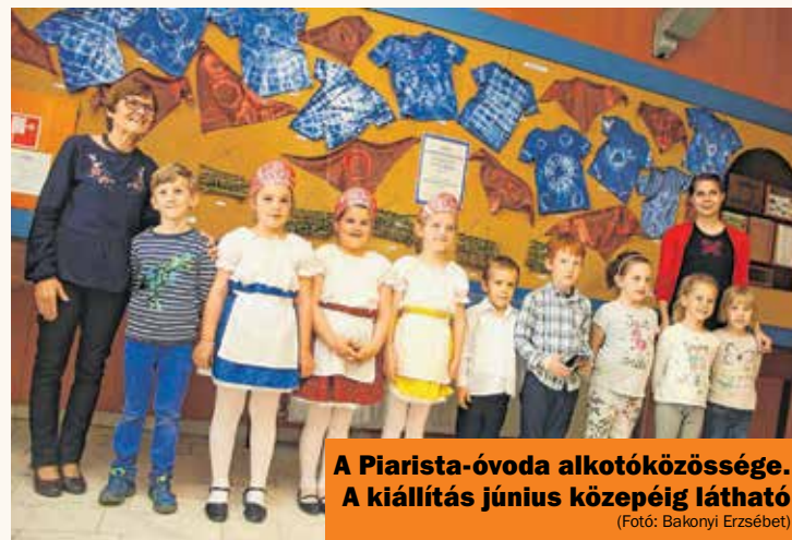
A Piarista-óvoda alkotóközössége. A kiállítás június közepéig látható