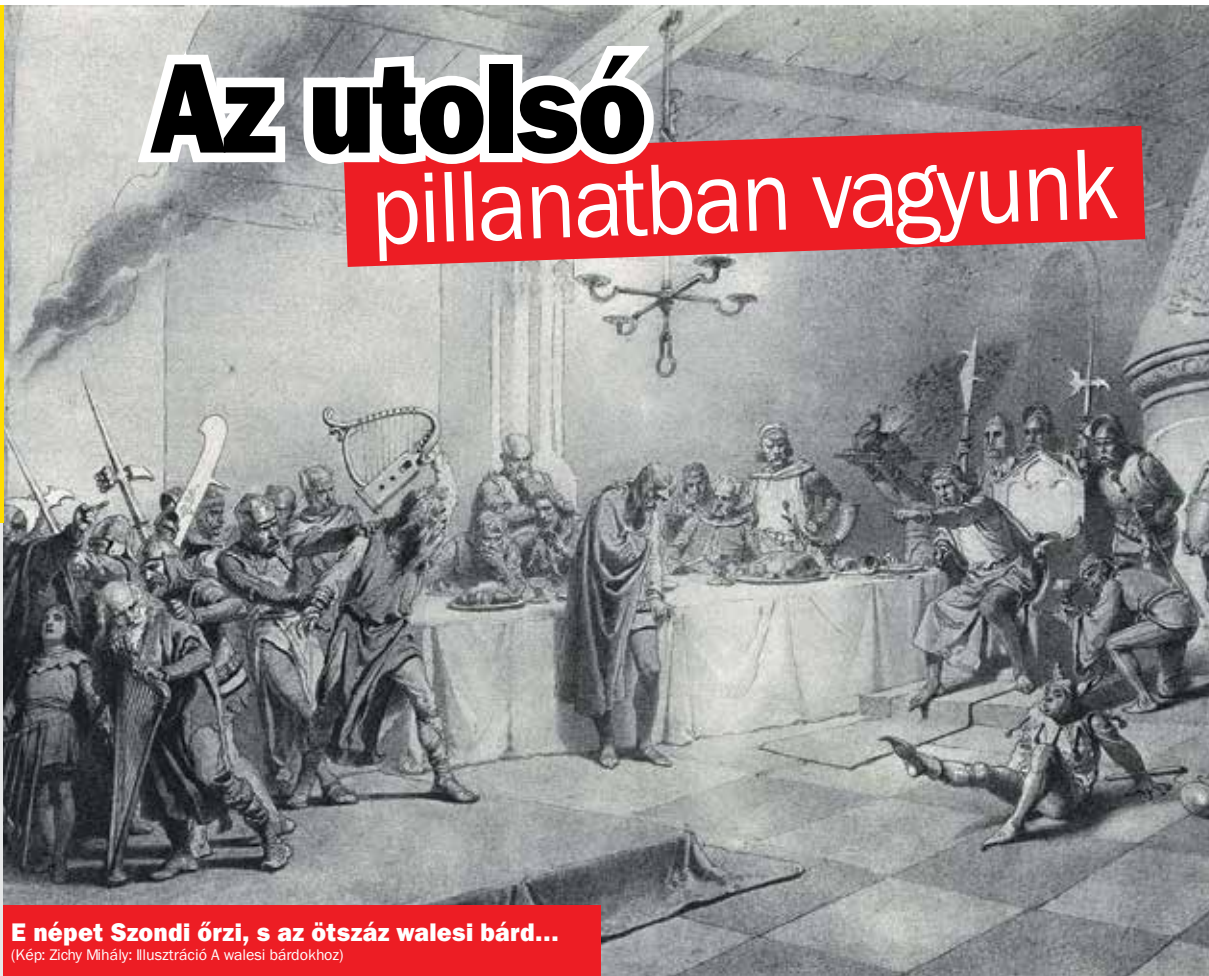
E népet Szondi őrzi, s az ötszáz walesi bárd...

Nem a véletlenek összjátéka, hogy mi magyarok vagyunk. Minden nemzet egyszeri és megismételhetetlen érték, és olyan sajátos értékgazdagság a nyelve, a kultúrája, amit csak és kizárólag az adott nemzet adhat az egyetemes emberiségnek. Senki nem adhatta a világirodalomnak Dosztojevszkijt, csak az oroszok, senki nem adhatta a világ zeneirodalmának Wagnert, csak a németek, és senki nem adhatta és adhatja az egyetemes emberiségnek Arany Jánost, Ady Endrét és Bartók Bélát, csak a magyarok. És ha mi eltűnünk a történelemből, akkor az egyetemes emberiség lesz szegényebb egy sajátos arccal, egy sajátos dallammal,