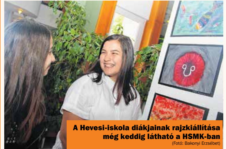
A Hevesi-iskola diákjainak rajzkiállítása még keddig látható a HSMK-ban