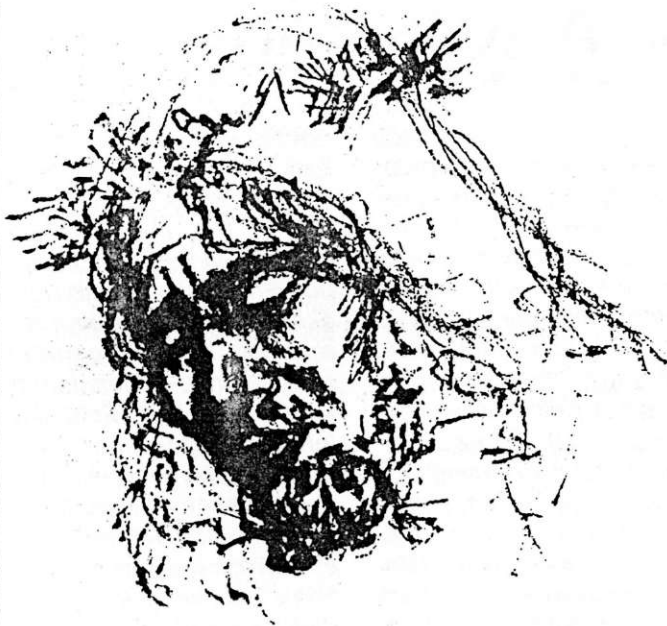
Ferkovics József rajza